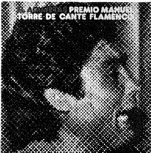
LP S 64954 EL AGUJETAS CBS